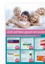
6 Produkte / Plakat