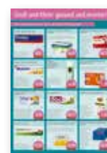
12 Produkte / Plakat