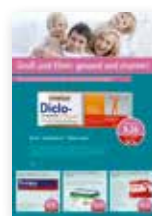
4 Produkte / Plakat

Bsp.: Plakat A1, Stückpreis 13,50 € (Auflage 2 Stück 3 ). Schon ab 1 Stück bestellbar.