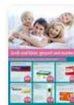
6 Produkte / Plakat